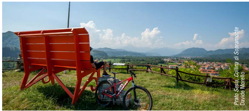
Prato Sesia, Collina di Sopramonte – Davide Morello