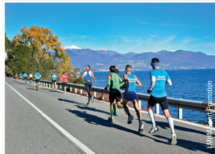
LMHM Sport Promotion

Località Villa Picchetta, 28062 Cameri (NO) - Tel. 011/4320011 www.parcoticinolagomaggiore.com parcoticinolagomaggiore@pec-mail.it