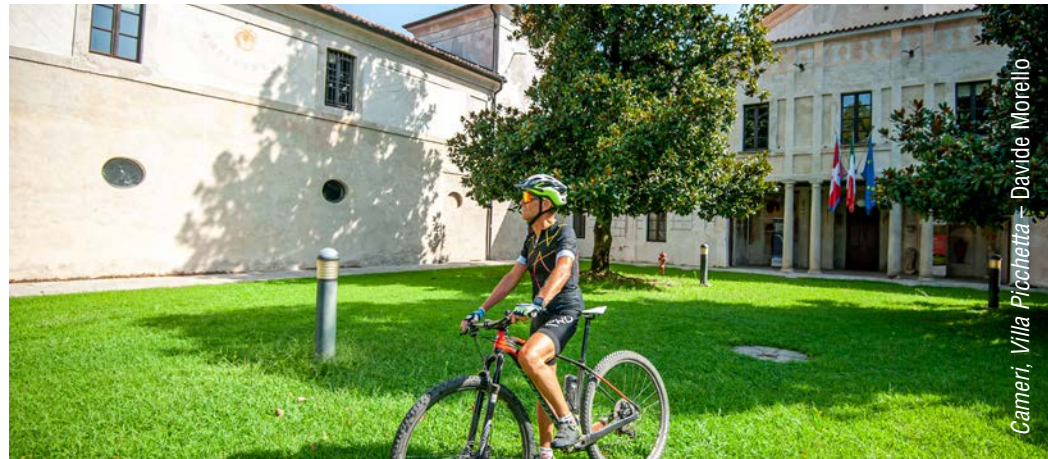
Cameri, Villa Picchetta – Davide Morello

Passata dalla proprietà privata all'Ordine dei Gesuiti e infine al Parco, secondo un calendario stabilito annualmente le grandi sale al piano terreno e i giardini sono aperti al pubblico e visitabili gratuitamente, anche con guida. La Villa si raggiunge dall'abitato di Cameri, in provincia di Novara, imboccando la Via Picchetta dal Santuario della Madonna di S. Cassiano e seguendo le segnalazioni. Nelle immediate vicinanze ci sono varie possibilità di ristoro e un centro equestre. Dalla Villa partono vari itinerari ciclabili e pedestri.